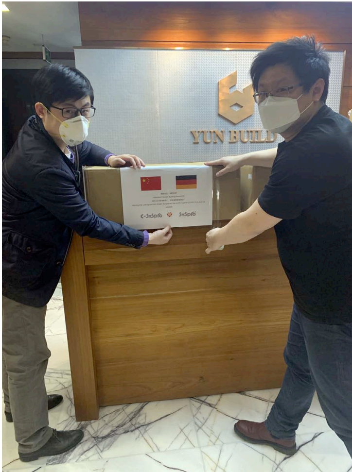
Versand der Mund-Nasen-Masken von Yun-Build