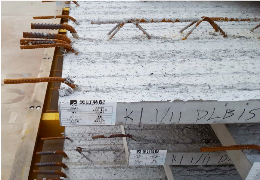
Überprüfung der korrekten Stapelung, Betonoptik, Rauheit der Verbundfuge sowie der Bewehrungslagen in China.