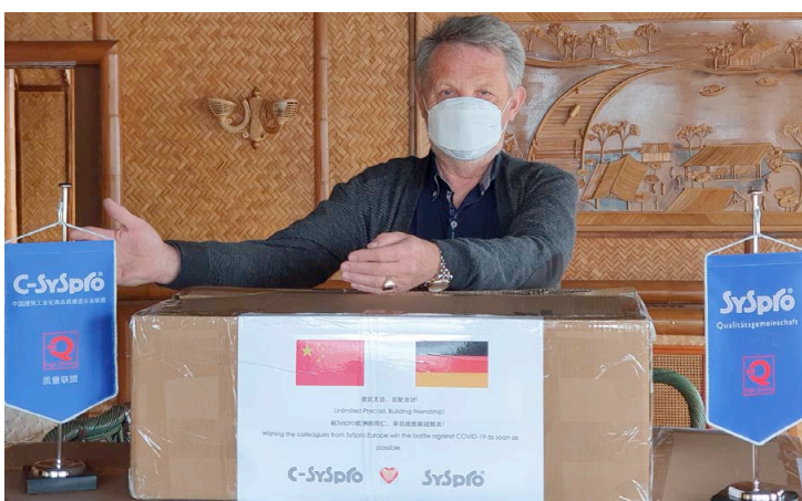
Empfang der Mund-Nasen-Masken-Lieferung in der europäischen Geschäftsstelle