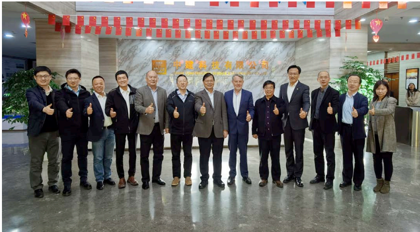
Abschluss des ersten HiQ-Audits in China im Oktober 2019